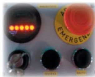
Indicateur du niveau de charge de la batterie