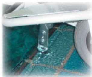
Pied d'appui automatique