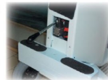
Pompe manuelle d'urgence