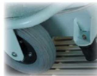
Tampons de sûreté