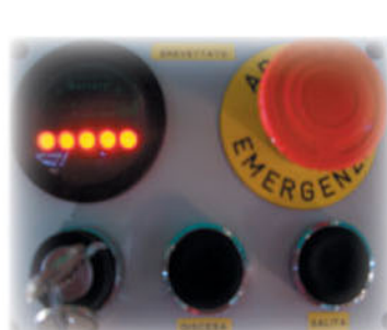
Segnalatore carica della batteria