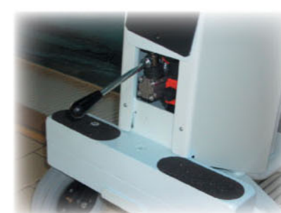
Pompa manuale d'emergenza