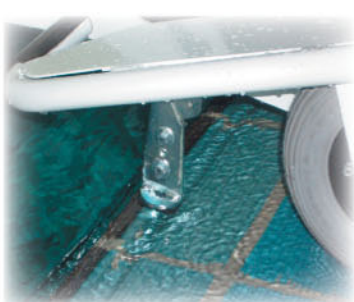
Piede d'appoggio automatico