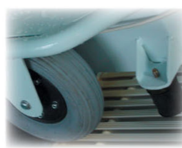
Tamponi di sicurezza